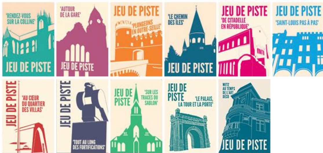
Couvertures des plaquettes de découverte du patrimoine messin de la Ville de Metz.