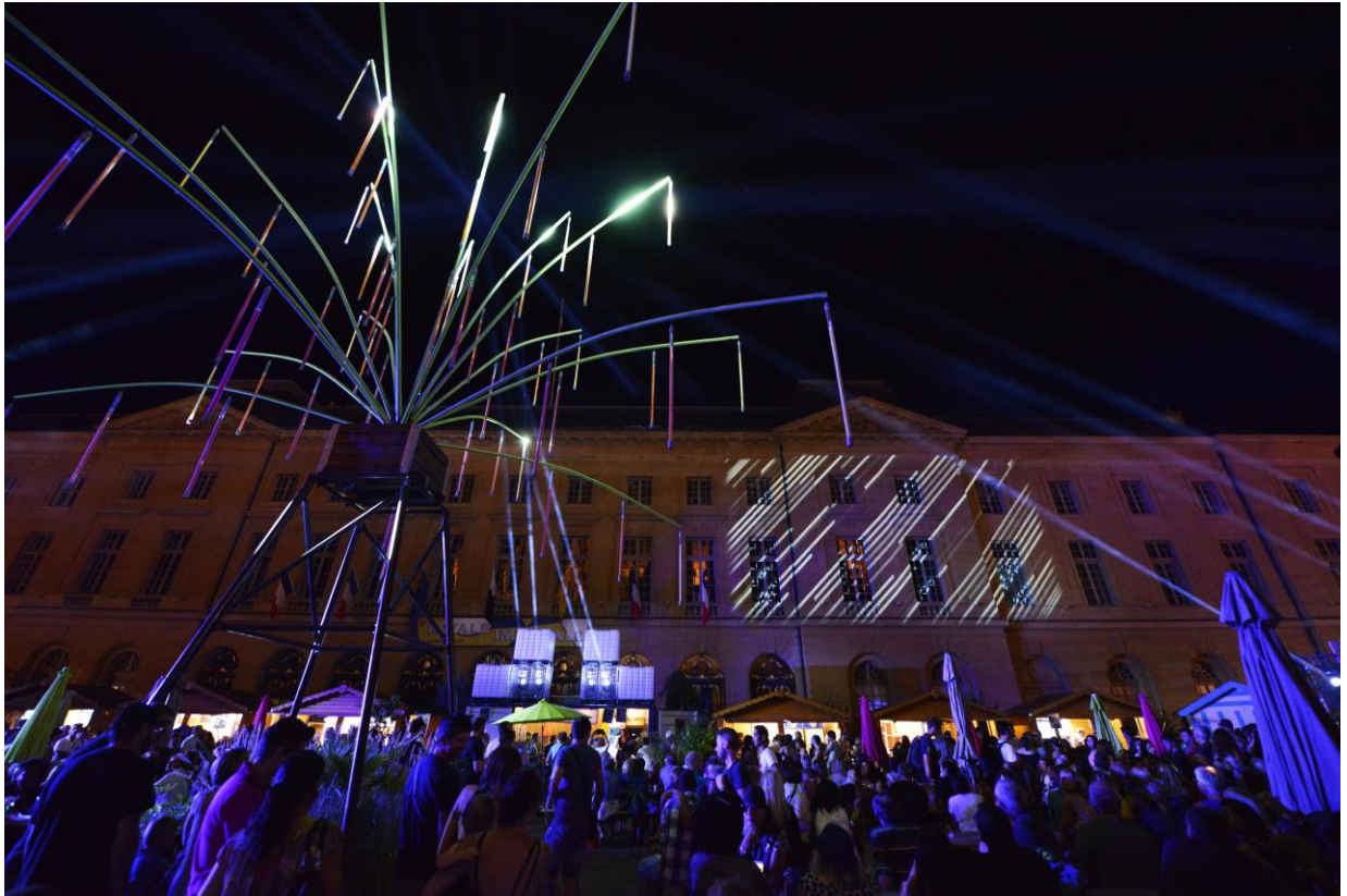
Vidéo-projection sur la façade de l'Hôtel de Ville | Fêtes de la Mirabelle 2016.