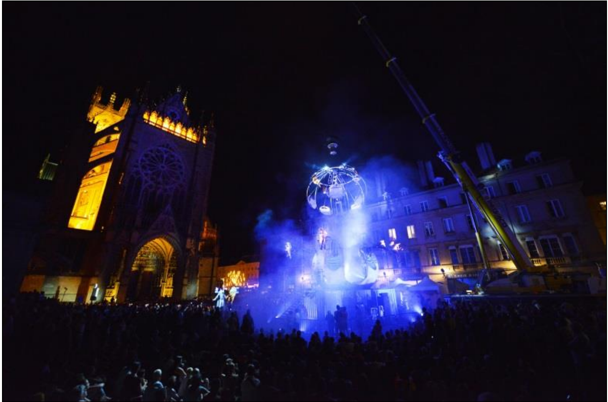
Spectacle d'art de rue aérien Mù de la compagnie Transe Express place Jean-Paul II | Fêtes de la Mirabelle 2016.