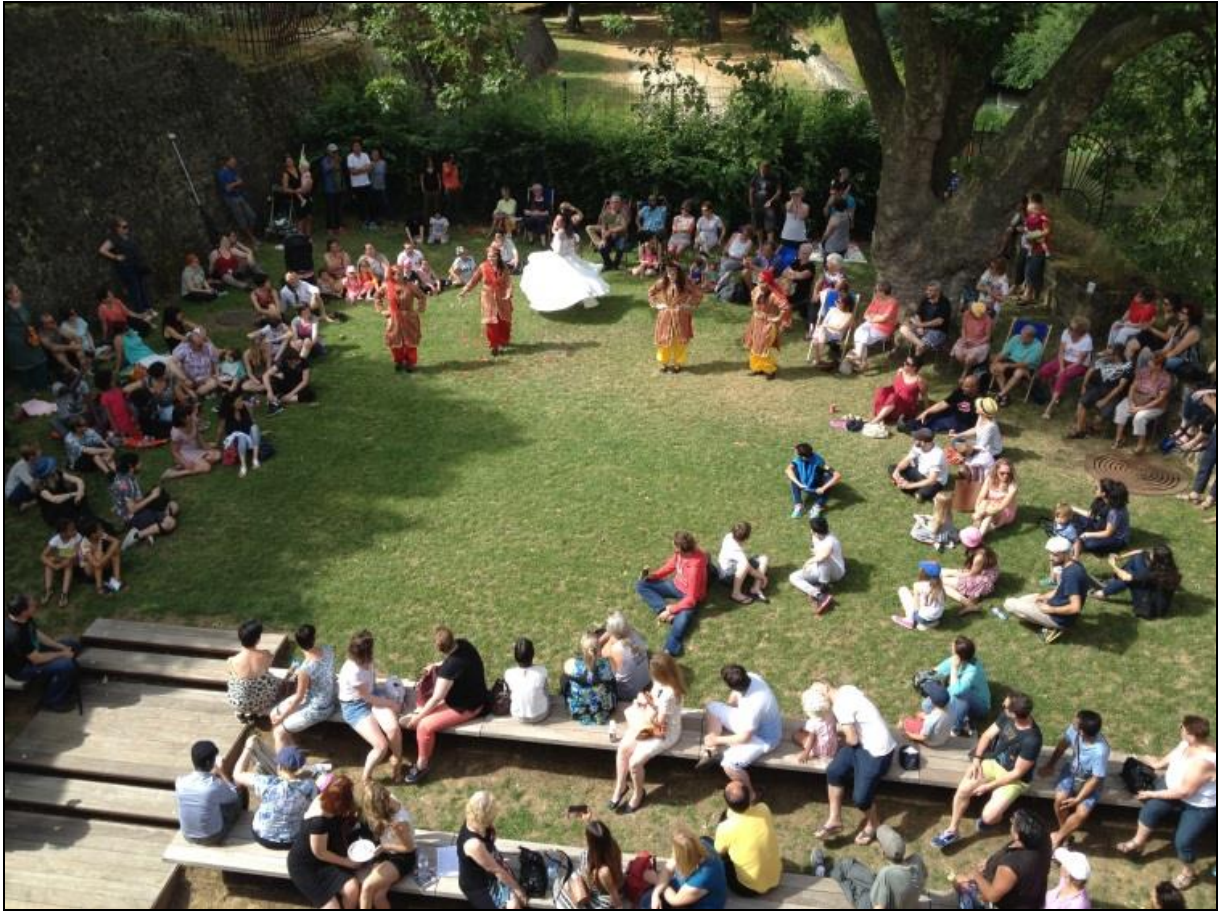
Spectacles proposés par l'association Bouche à Oreille avec les habitants de Borny Porte des Allemands | RDV culturels de l'Été 2016.