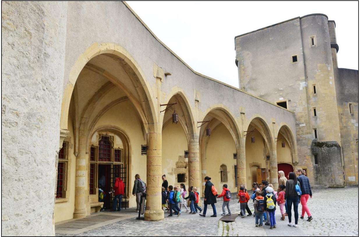
Visite scolaire de la Porte des Allemands | 2016.