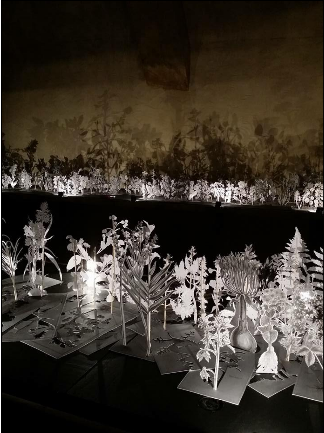
Exposition Jardins de Papier Porte des Allemands | Été 2015.